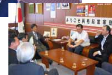
行政官庁との交流風景