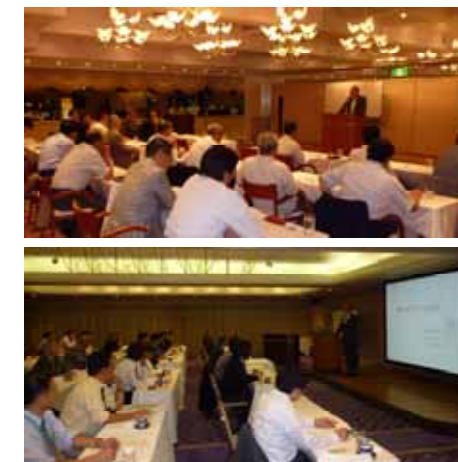
毎回各分野で活躍するゲストスピーカーを招いて開催する例会の風景